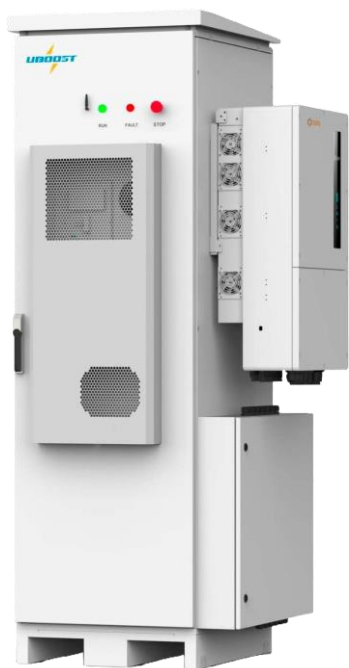
*Farbe kann abweichen, nur zu illustrativen Zwecken